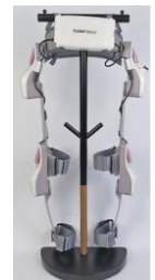
フルセット (4関節タイプ)