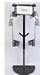
ハーフセット (2関節タイプ)